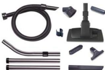
Inklusive Zubehörset AS0