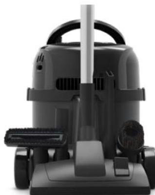
Mit Parkfunktion und Zubehörhalterung